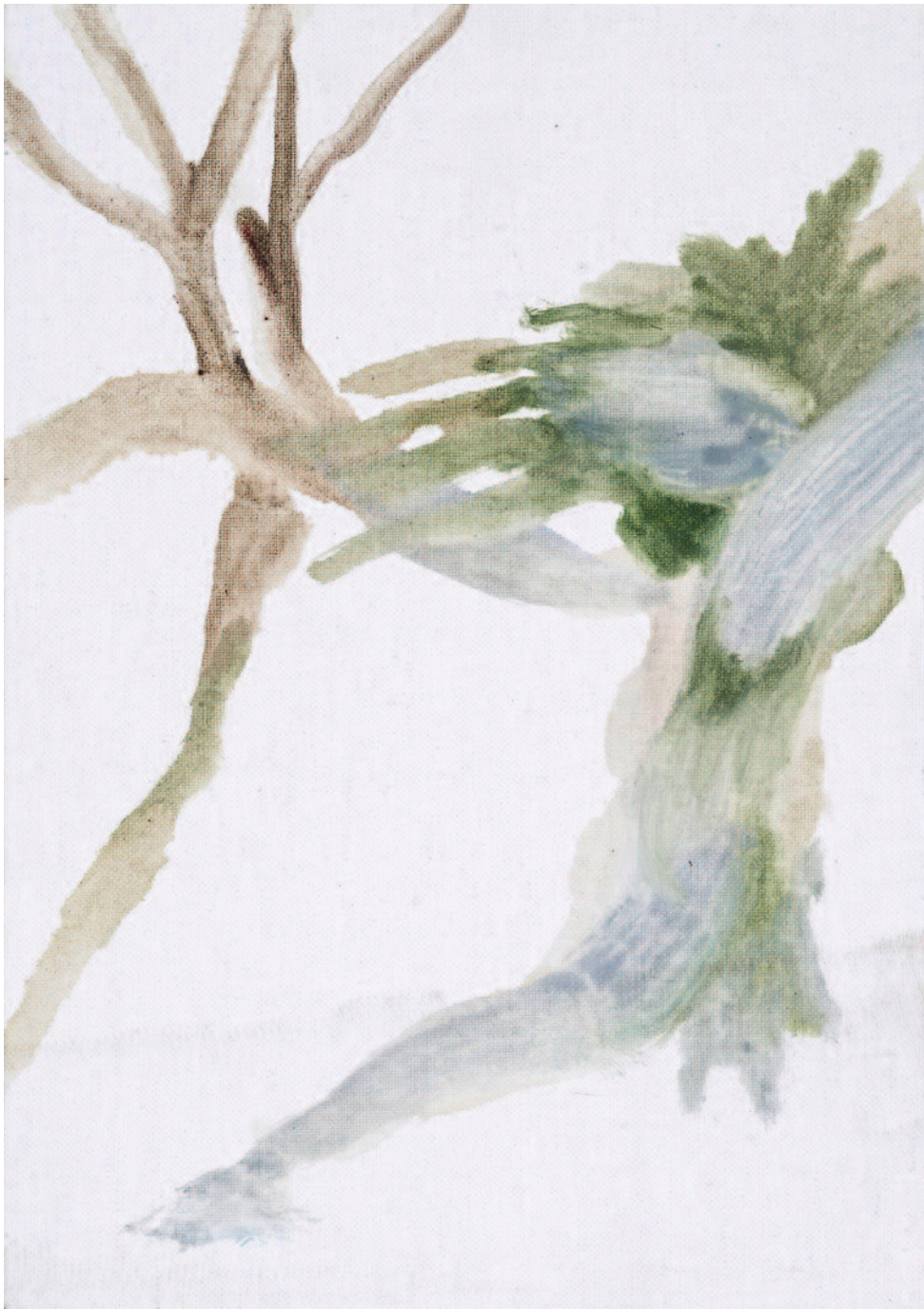
© Julie Poulain, La Fugitive - huile sur toile, 27x19 cm, 2018 (courtesy of the artist).